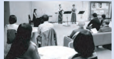
オープニングコンサート